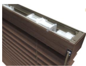
NORMAN® ループコード式 G3機構イメージ